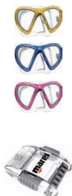
Hebilla de ajuste rápido EZ