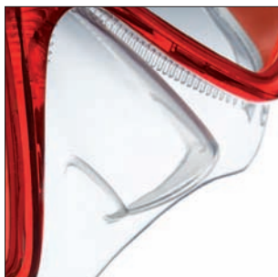
Ecuilización ergonómica de la nariz

X-vu LiquidSkin es la primera máscara con doble lente que emplea la tecnología LiquidSkin después de X-vision. Además de la comodidad natural que proporciona el faldón LiquidSkin, se ha inyectado otra sección de silicona blanda en la nariz que actúa como parachoques. Las hebillas de 2 botones son una innovación en esta máscara.