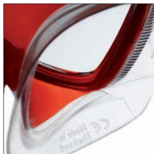
Sistema de drenaje