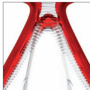
Sistema de liberación de la presión