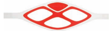
Correa para máscara LiquidSkin